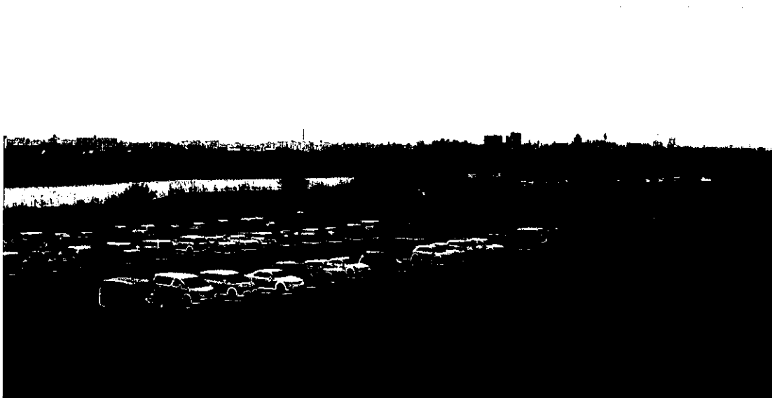
2013年3月に19番グラウンド隣に完成した新駐車場。前面の「緊急用河川敷道路」は大規模災害発生時の救援活動や復旧活動用のため駐車禁止です

19番グラウンドの北側に5200平方メートル、約200台分の新駐車場が完成しました。これに合わせ、臨時駐車場として使用してきた17番グラウンドは、野球場として復活いたしました。